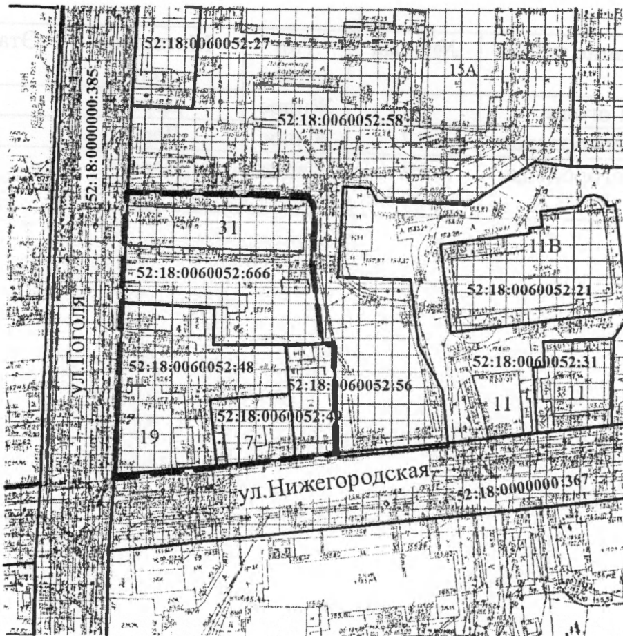
Схема размещения застроенной территории, подлежащей развитию

— — — — — Границы застроенной территории, подлежащей развитию