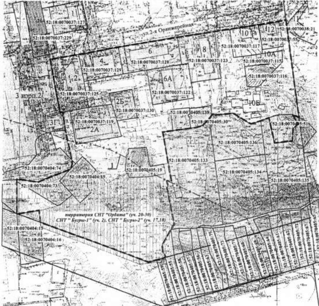
Схема размещения застроенной территории, подлежащей развитию