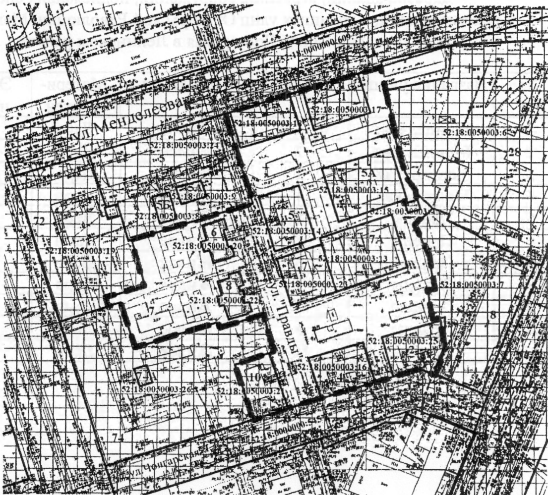
Схема размещения застроенной территории, подлежащей развитию

— — — — — Границы застроенной территории, подлежащей развитию